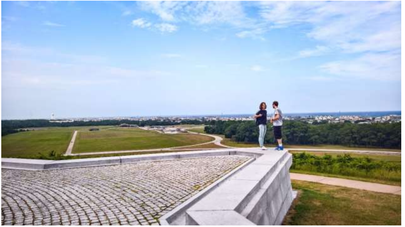
А ось і сам Монумент братам Райт: